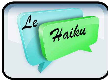
Phase 2: le Haïku

du 09/11/2017 au 17/11/2017 Rencontre synchrone le vendredi 17/11/2016.