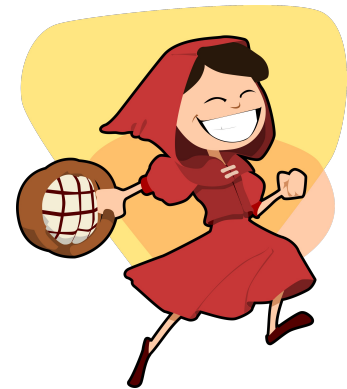
Phase 3: le conte traditionnel (ou presque)

du 11/01/2018 au 19/01/2018. Rencontre synchrone le 19/01/2018.